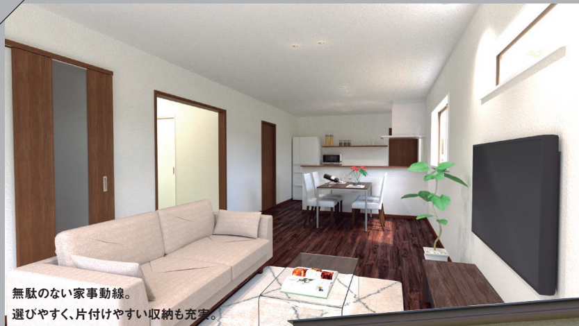
無駄のない家事動線。 選びやすく、片付けやすい収納も充実。