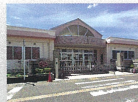
ゆたかこども園…約1.2km