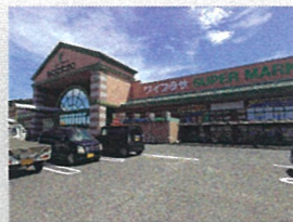
ワイプラザ鯖江店…約3.3km