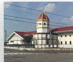
千寿たんばこども園…約1km