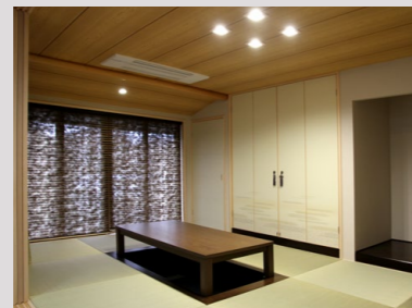
和室(掘りごたつ付)